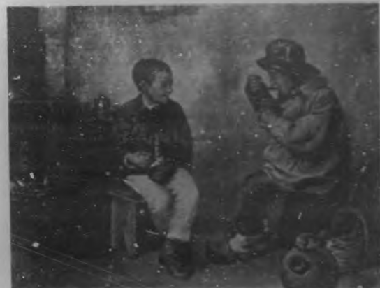
Óleo de P. Bono, que aparece en la edición de "Bohemia", dedicada al "Centro Gallego de la Habana, en perfecta tricornia.

Todos los grabados y la impresión de esta grandiosa edición han sido hechos y confeccionados en los talleres, imprenta y fotograbados de Bohemia, que posee en su edificio de Trocadero 89, 91 y 93. El precio del ejemplar es de un peso.