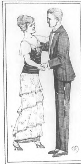
Lámina Núm. 8

Tratado completo de bailes de sociedad. Lecciones fáciles y prácticas para aprender el One Step, Walking, Boston, Hesitation Waltz, Dream Waltz, Tango Argentino y Fox-Trot. Por Miss Josephine Clements. Ilustraciones de A. R. Maribona.