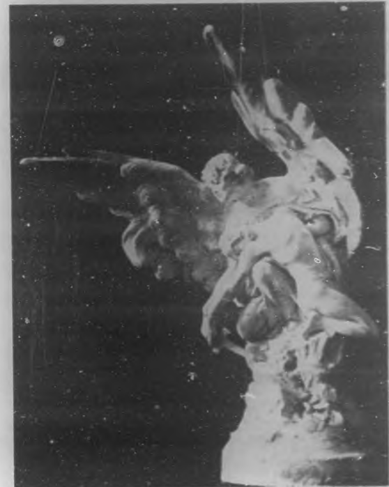
LA GLORIA DEL SOLDADO.—Notable boceto escultórico por G. Moretti.

aparta un instante de nuestros ojos no podía sustraerse de sus efectos.