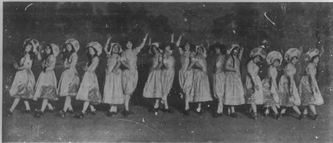
LA OPERA EN EL NACIONAL.—Una parte del nutrido cuerpo de baile de la compañía de Titta Rufo que en breve debutará en dicho teatro.