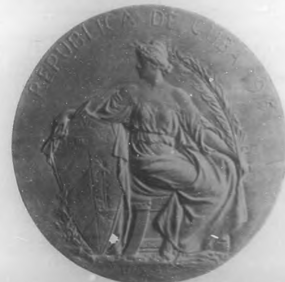
LA MONEDA NACIONAL.—Artesano de bronce ejecutado por el escultor G. Moretti para ser estampada en la estampa de la moneda nacional.

Una prueba de ello es el admirable grupo escultórico que con gran inspiración y maestría