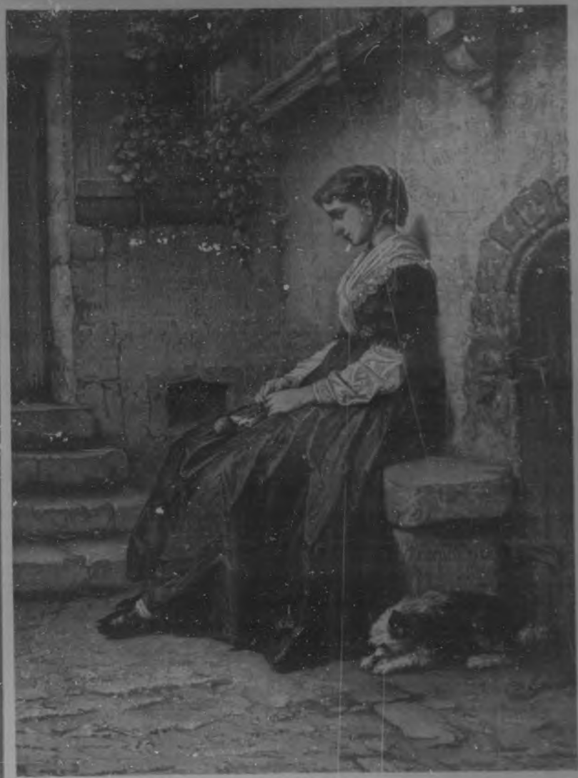
LA HUERFANA. Cuadro por F. Compe-Calix